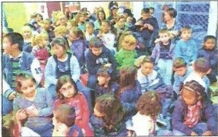
Une cinquantaine d'enfants ont assisté au spectacle de marionnettes.